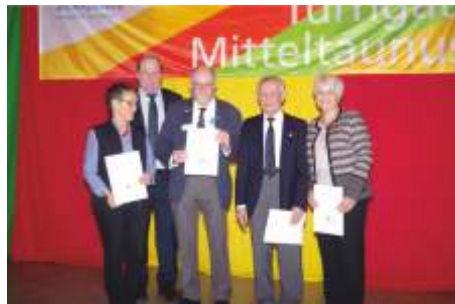
Ehrungsveranstaltung des Turngaues in Eschenhahn, März 2019