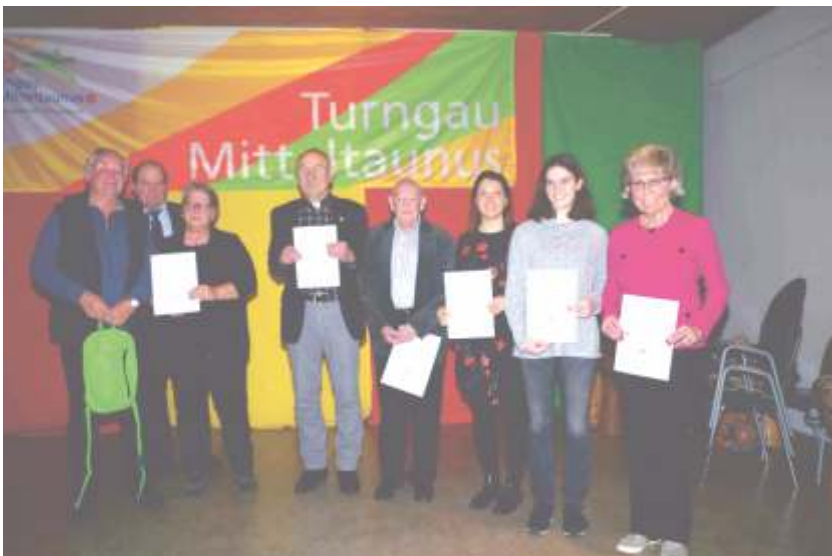
Ehrungsnachmittag des Turngaus in Eschenhahn 2019.