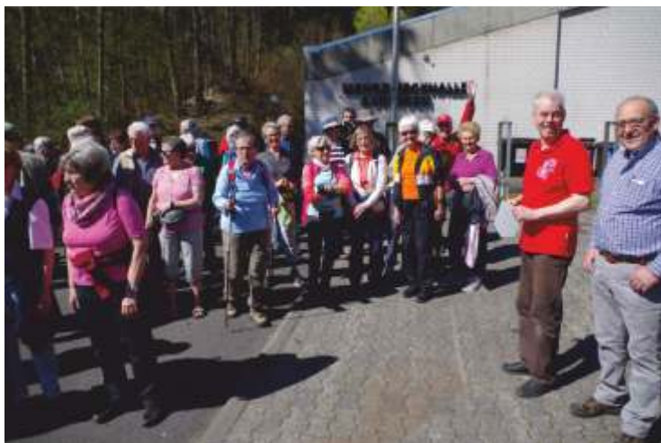
Start zur Gaufrühjahrswanderung in Auringen

ca. 13.30 Uhr Beginn der ersten Siegerehrungen