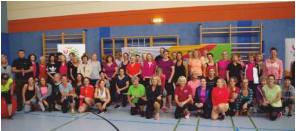
Teilnehmer der Taunus Convention 2019 in Hahn