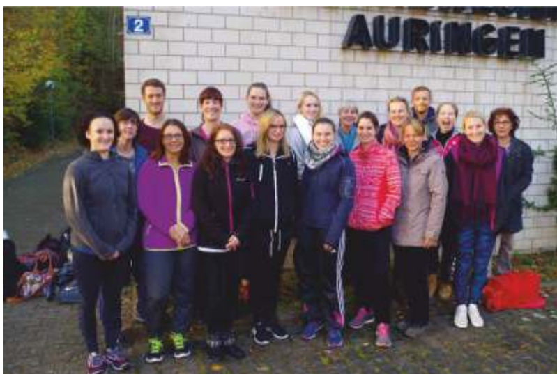
Übungsleiterausbildung Grundmodul in Auringen, Teilnehmer und Orgateam