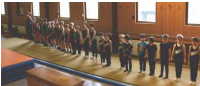
Geräteeinzelwettkämpfe der Jungen 2017 in Delkenheim

Boden P4: Position 4: Nachstellsprung re, Nachstellsprung li. ( oder Seitenverkehrt) Anhüpfer Rad: Rad in allen Variationen erlaubt mit Drehung im Rad oder danach