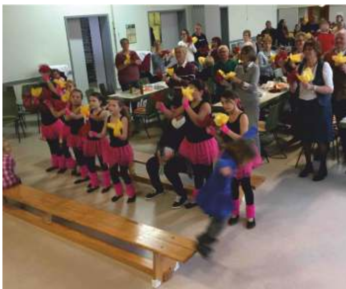
Best Ager Meeting 2017 in Idstein Walsdorf