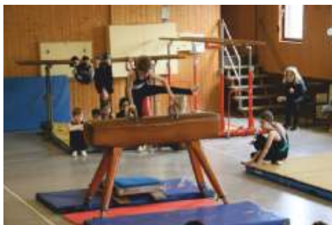
Geräteeinzelwettkämpfe der Jungen 2017 in Delkenheim