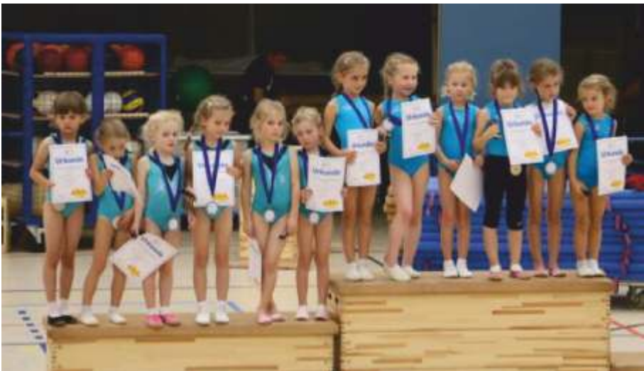
Nachwuchsgerätemannschaftswettkämpfe 2017 in Naurod