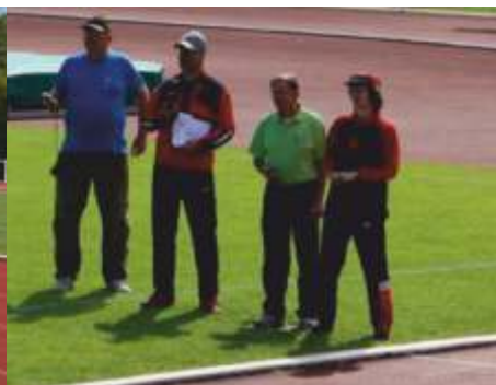
Wettkämpfer und Kampfrichter bei den Gaumehrkampfmeisterschaften 2017 in Idstein